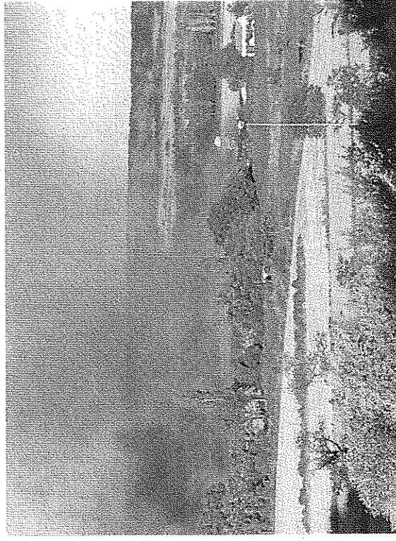
La gran columna de humo que generó el incendio.

HUESCA. Los bomberos de Huesca intervinieron ayer cerca del casco urbano para sofocar un incendio que se declaró en unos rastros situados en las cercanías de la ermita de Salas. El fuego se inició a última hora de la tarde y el viento que soplabla hizo que se extendiera con gran rapidez. Los efectivos desplazados controlaron pronto su avance, aunque permanecieron en el lugar varias horas hasta que se extinguió totalmente. La situación generó gran expectación entre los vecinos debido a su proximidad al núcleo urbano.